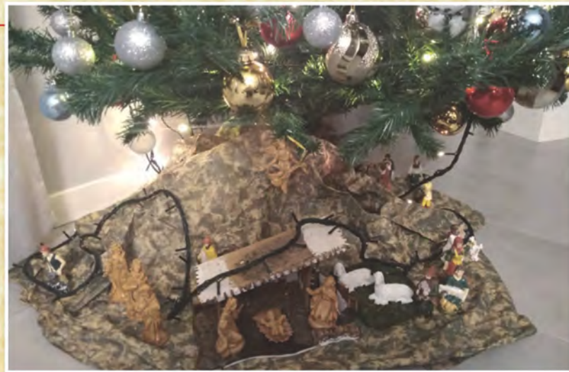
Presepe realizzato dai bambini Giorgia e Federico Nicoli, di Rezzato - Brescia