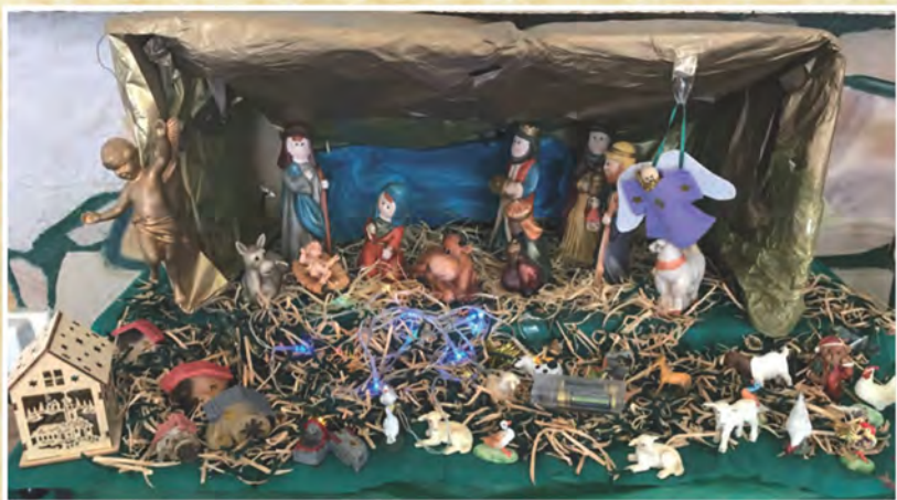
Presepe di Elvira Costanzo di Adelaide - Australia