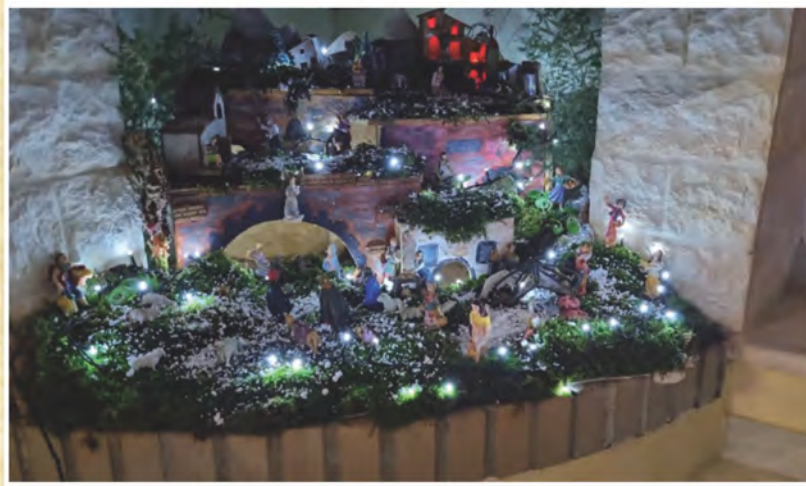
Presepe della famiglia Farina Cancellu di Sassari