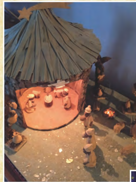
Presepe di Giovanni Di Ferioli di Marnate - Varese