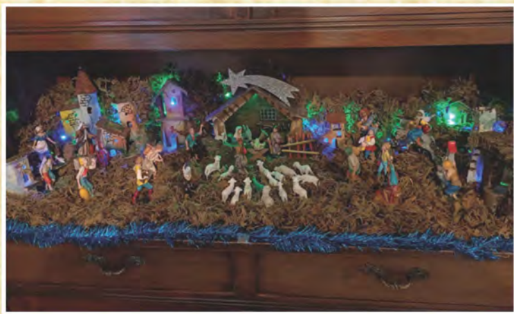
Il Presepe di Rosangela Carrara di Rovato - Brescia