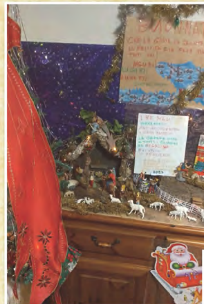
Presepe di Eleonora Foschi di Alghero - Sassari