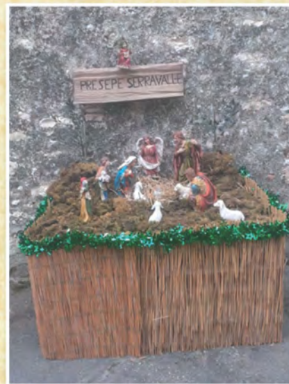
9 Michela Gozzo di Illasi - Verona ci manda la foto del Presepe realizzato in Via Serravalle