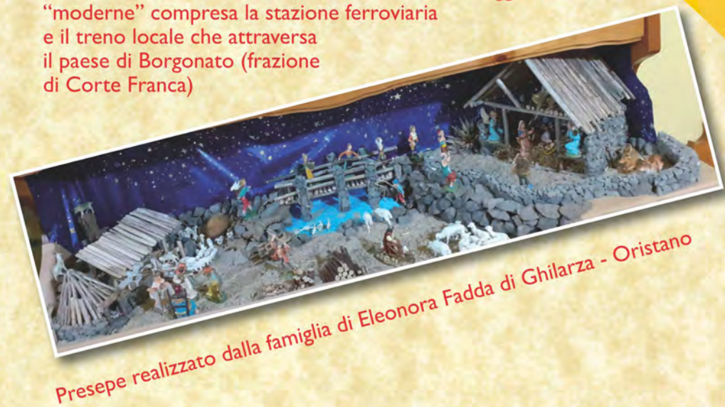
Presepe realizzato dalla famiglia di Eleonora Fadda di Ghilarza - Oristano