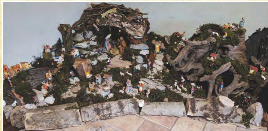
Presepe di Margherita Bodei di Serle - Brescia