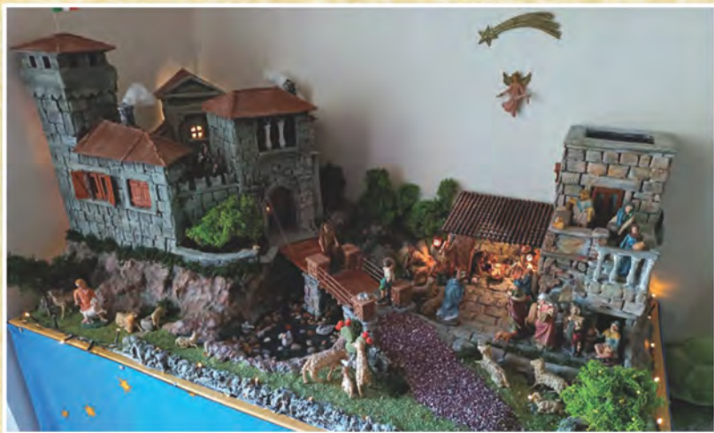
Presepe di Alberto Raganato di Palestrina - Roma