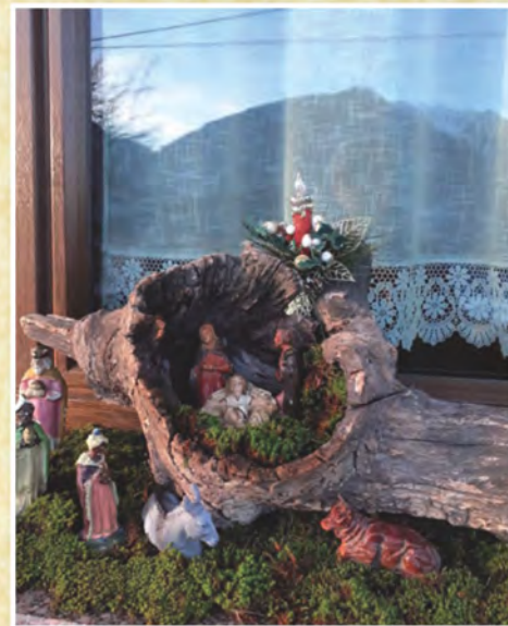
7 Presepe della signora Bertolini Natalina Travaini di Buglio in Monte - Sondrio