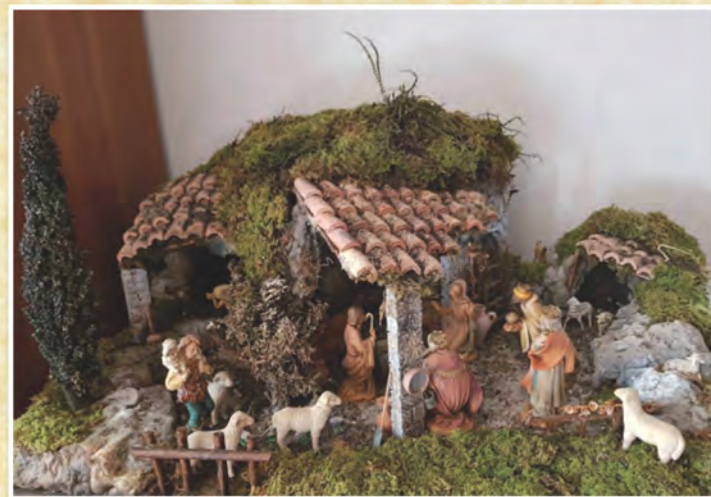
Presepe di Roberto Furlan di Colle Umberto - Treviso