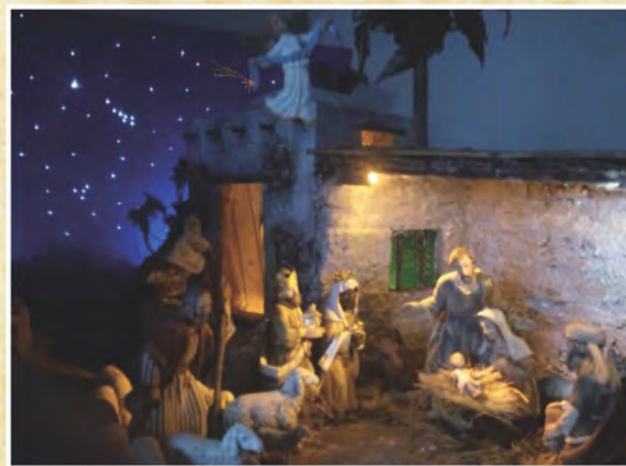
Presepe di Edoardo Ferrario di Ossona - Milano