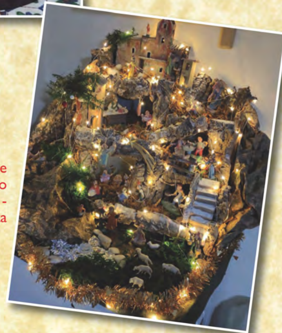
Presepe di Annarita Siviero di Casapulla - Caserta