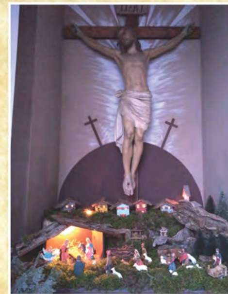
Presepe collocato nel capitello di Migazzone (eretto nel 1933) nell'altipiano della Vigolana - Trento