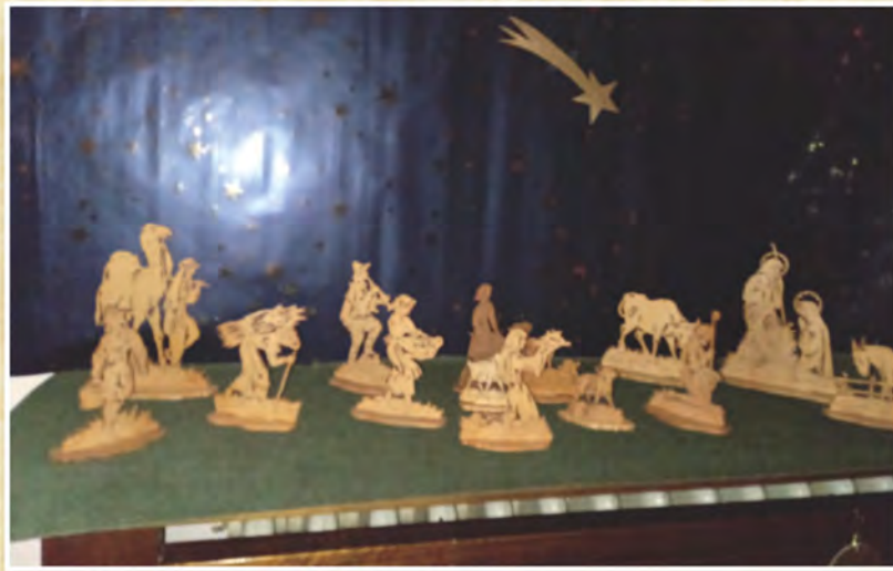
Presepe di Giovanni Ferioli di Marnate - Varese