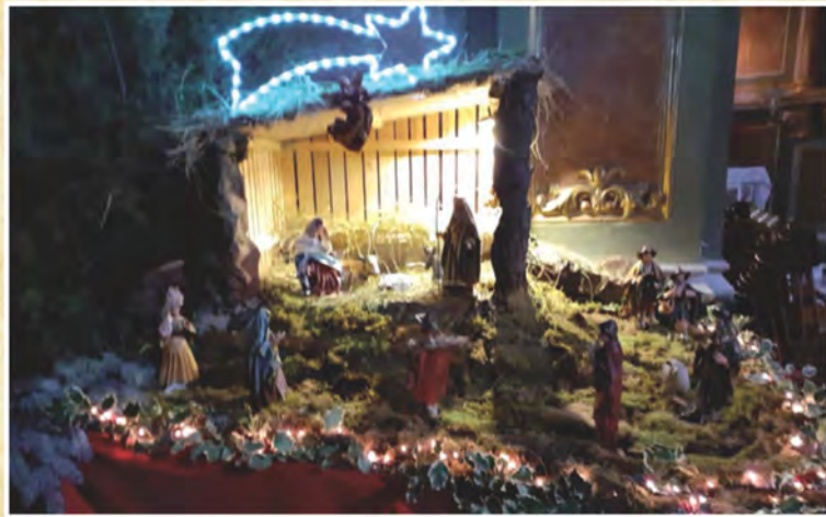
Presepe della parrocchia San Bernardo di Campomorone - Genova