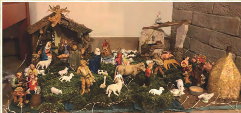
Il Presepe di Lorenzo Borelli, di Firenzuola - Firenze