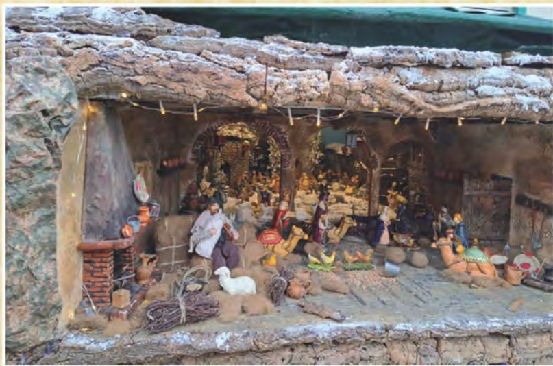
Particolare del Presepe di Antonia Pusceddu di Vallermosa - Sud Sardegna