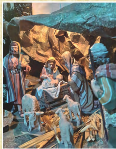
Presepe di Luigi Ferrarese, di Brienza - Potenza