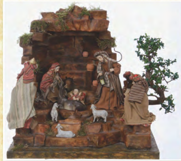
Il presepe realizzato da Gloria Bellini di Cattolica - Rimini