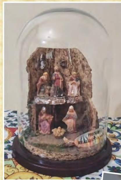
Il Presepe di M.D.L. di Palermo