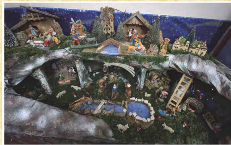
Presepe della famiglia Argese-Di Salvatore di Latiano - Brindisi