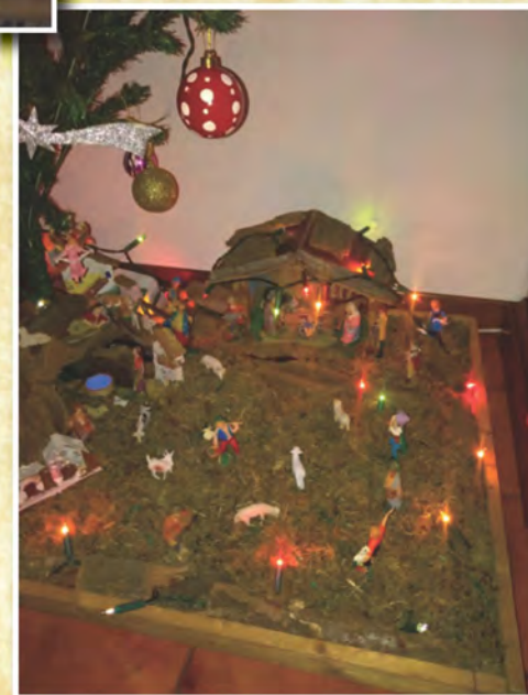
Presepe di Emilio Magni di Molteno - Lecco