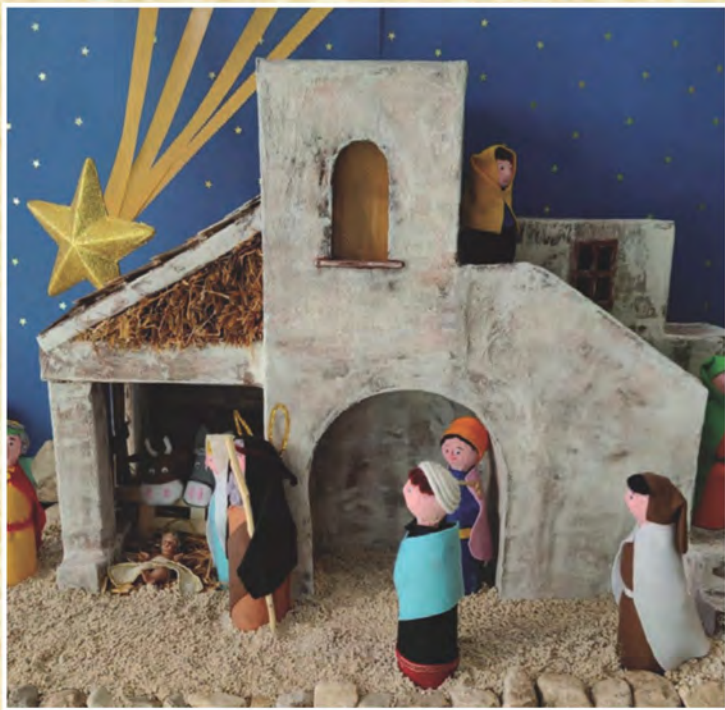
L'originale Presepe realizzato dai bambini della Scuola d'Infanzia di Greccio (Rieti) sezione E

Il mirabile segno del presepe , così caro al popolo cristiano, suscita sempre stupore e meraviglia. Rappresentare l'evento della nascita di Gesù equivale ad annunciare il mistero dell'Incarnazione del Figlio di Dio con semplicità e gioia. Il presepe, infatti, è come un Vangelo vivo, che trabocca dalle pagine della Sacra Scrittura. Mentre contempliamo la scena del Natale, siamo invitati a metterci spiritualmente in cammino, attratti dall'umiltà di Colui che si è fatto uomo per incontrare ogni uomo. E scopriamo che Egli ci ama a tal punto da unirsi a noi, perché anche noi possiamo unirci a Lui.