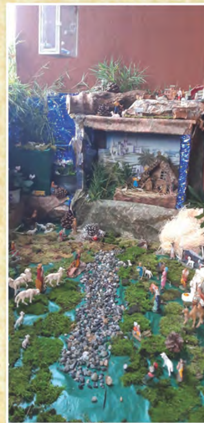
Presepe costruito da Isabel Tarchini con l'aiuto del nonno Luigi Dorini di Pognano - Bergamo