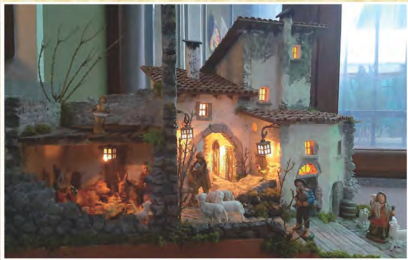
Il Presepe realizzato dalla famiglia Capra di Pavia