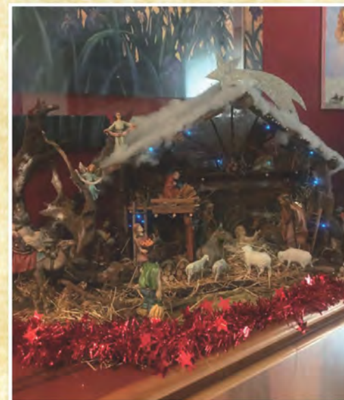
Presepe di Silvia Vanzati di Nova Milanese - Monza Brianza