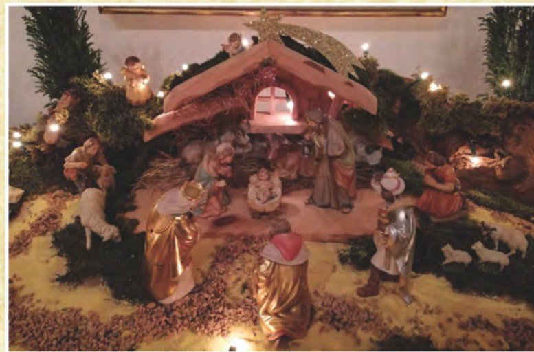
Il Presepe realizzato in casa da MariaElena Cavalli di Podenzano - Piacenza