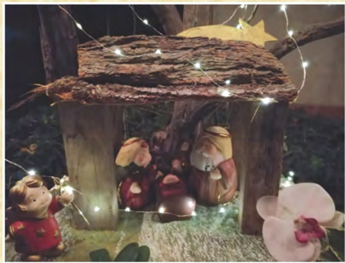
Il Presepe realizzato in giardino da MariaElena Cavalli di Podenzano - Piacenza