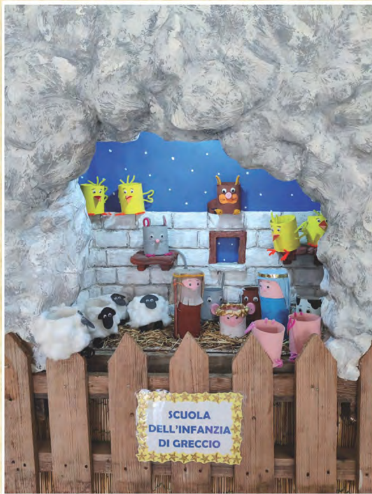
L'originale presepe realizzato dai bambini della Scuola dell'Infanzia di Greccio (Rieti) sezione F